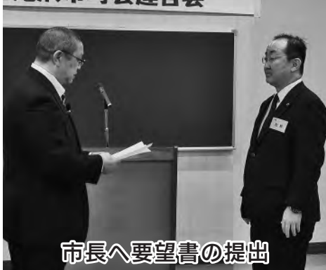
市長へ要望書の提出