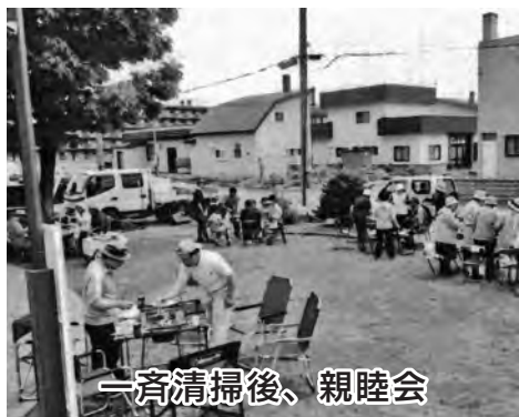
一斉清掃後、親睦会