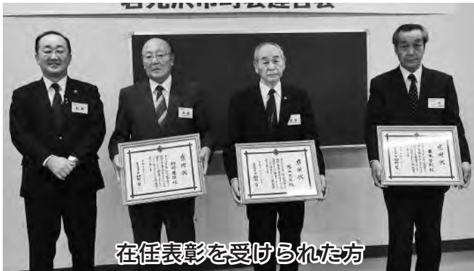
在任表彰を受けられた方