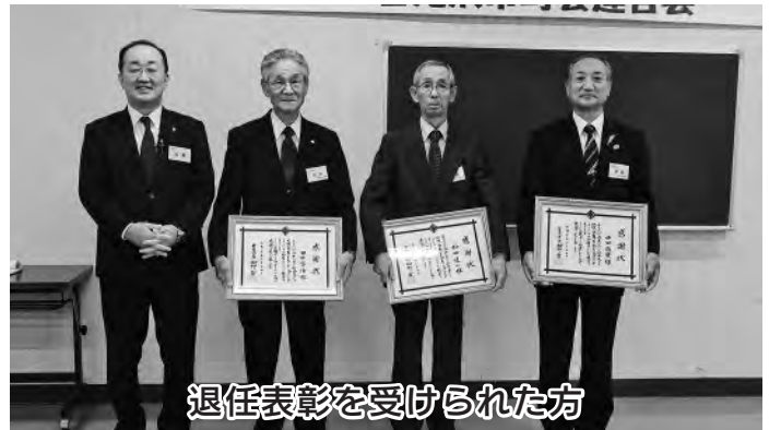
退任表彰を受けられた方